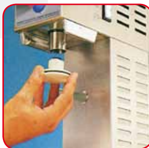
Pistone in Makrolon® facilmente removibile per una perfetta pulizia