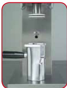
Stampi in alluminio anticorrosivo. Stampo Spaghetti di serie