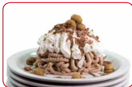
Composizione ottenuta con stampo "Spaghetti"